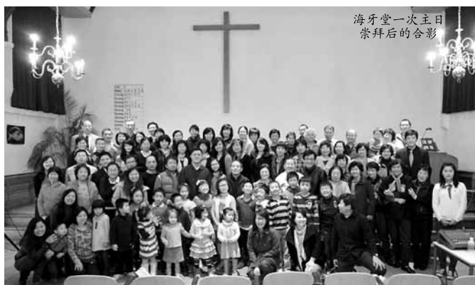
海牙堂一次主日 崇拜后的合影

我们在荷兰华人基督教会海牙堂已经服侍一年半了，时间不是很长，却经历上帝奇妙的恩典。让我们这刚刚踏上侍奉道路不久的工人，不得不惊叹，上帝的作为是何等的伟大！