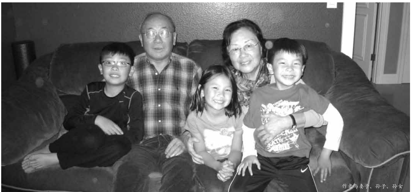
作者与妻子、孙子、孙女

我们在2009年说过这句话，在这里再重温一遍。在《荒漠甘泉》一书中，考门夫人说：“对已过的昨天心存感恩，对眼前的今天努力奉献，对未来的明天付托主恩。”它提醒我们要好好活着，不可懈怠，传福音更是要义不容辞。求神保守我们的心怀意念，“那等候耶和华的，他们必如鹰展翅上腾，他们奔跑却不困倦，行走却不疲乏。”当我们迎向2014年，巴不得上帝的全能与恩惠，耶稣基督舍身的爱与救赎，圣灵的保守与平安，常与我们众人同在。